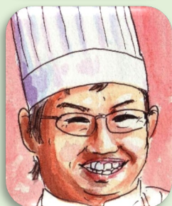
三代目店主のスケッチのInstagram