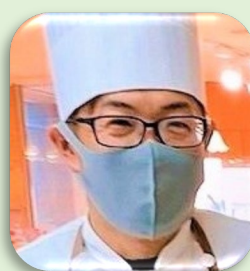
清水菓子舗とスイーツ関連のInstagram