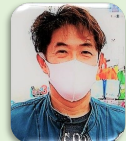
三代目店主のブログ 「香川でのたうつ菓子屋のブログ」