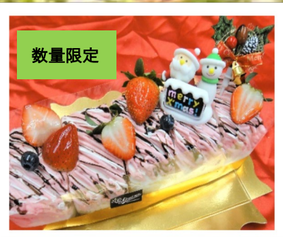
ラズベリーロール 25×6cm 2000円