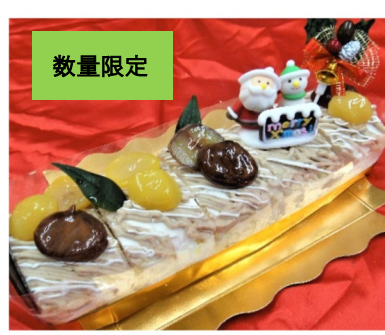
モンブランロール 25×6cm 2000円