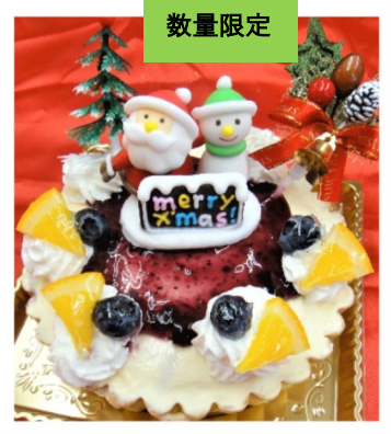
レアチーズケーキ 12cm 1800円