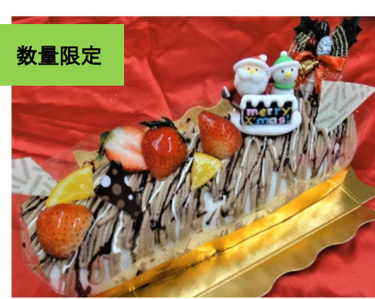
チョコロール 25×6cm 2000円