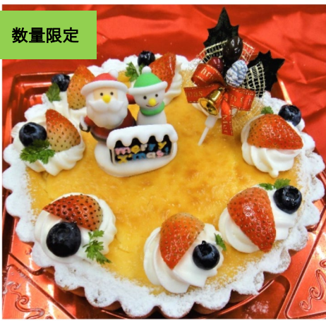
こくまろチーズ 18cm 2900円