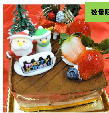
チョコの石畳 12×10cm 2000円