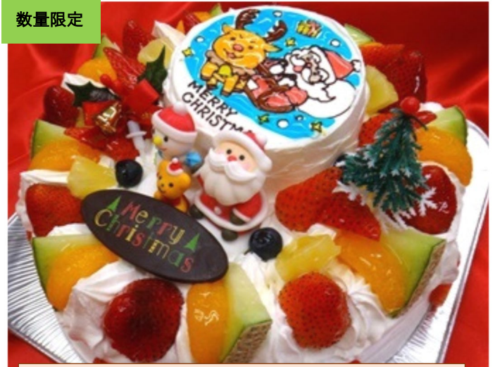
スペシャルクリスマス 25cm2段 8000円